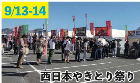
西日本やきとり祭り

西日本のやきとり名店11店舗が湊に集結！猛暑にも関わらず2日間で約3.4万人が来場。どこも大行列で大変な賑わいでした。