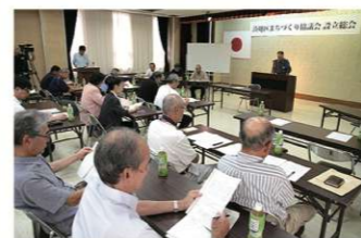
設立総会の写真

湊地区まちづくり協議会は、長門市との連 携のもとに湊地区に暮らす住民が、主体的な まちづくり活動を通 じて、住民相互のつ ながりや伝統を継承 しながら、活気と魅 力にあふれる住みよ いまちをつくること を目的とし、2016年9月に設立されました。