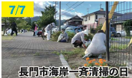
長門市海岸一斉清掃の日